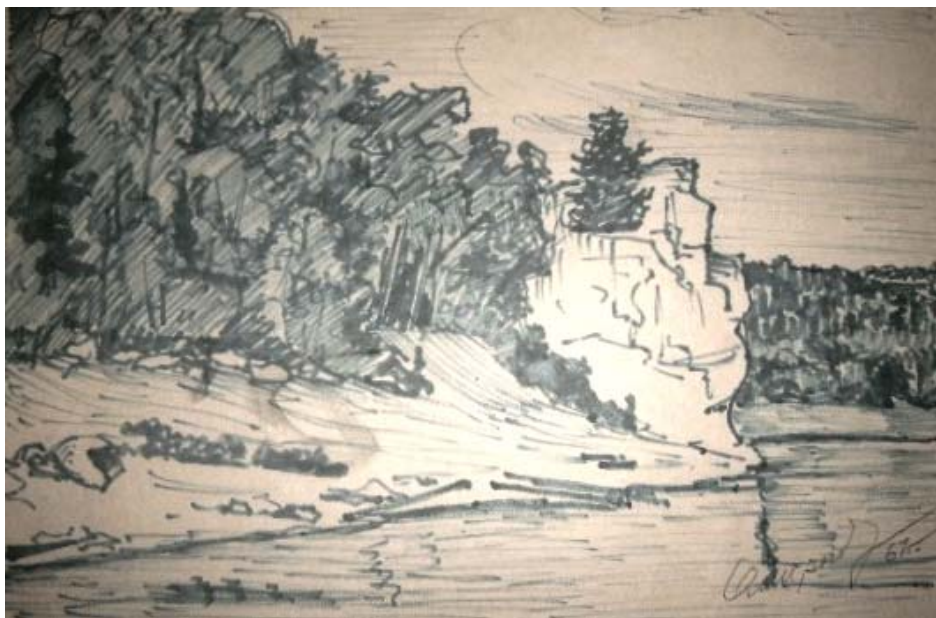
«На Чусовой». Бумага, карандаш, 1967г.