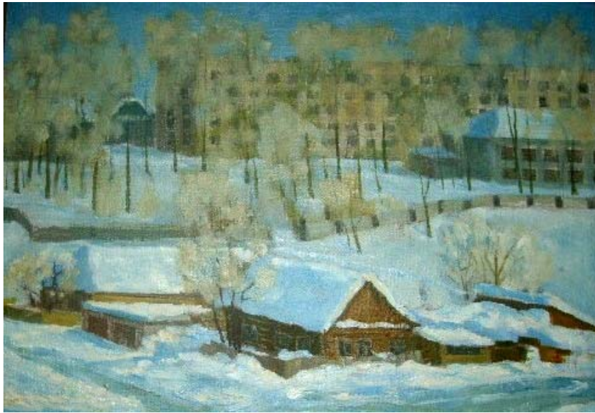
«Зимний пейзаж», х.м. 1998г.