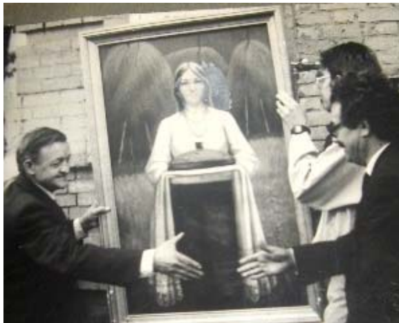
На открытии мемориальной доски Герою Советского союза Иванову Е.Н., 1967г.

Я горжусь своим дедушкой и очень его люблю.