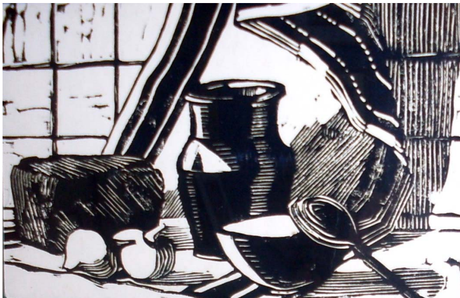
«Натюрморт» линогравюра, 1987г.