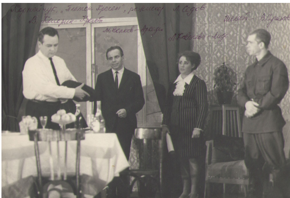
Сцена из спектакля по пьесе А.Корнейчука «Платон Кречет». 1970 г.