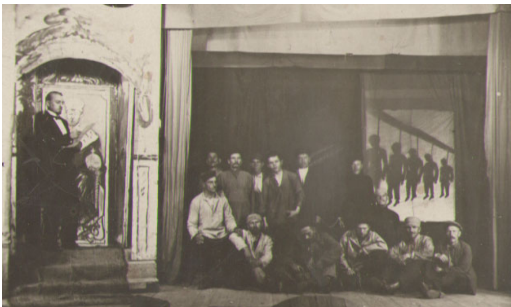
Сцена из спектакля о восстании в Лысьве 20 июля 1914 г. 1927 г.