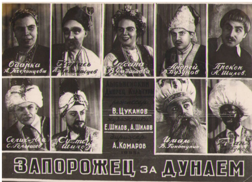
Афиша оперетты «Запорожец за Дунаем». 1955 г.