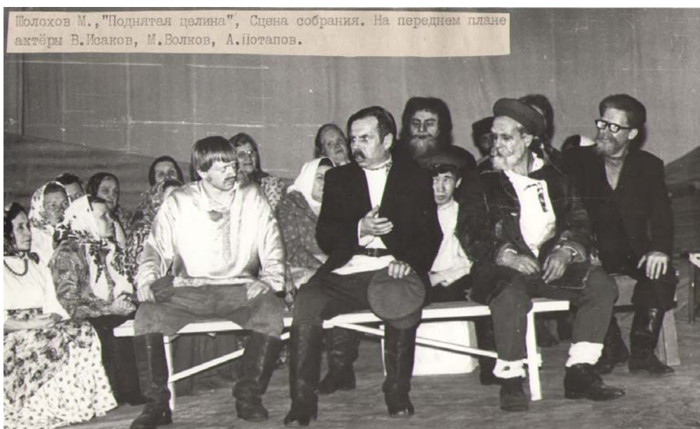
Сцена собрания колхозников из спектакля по роману М.А.Шолохова «Поднятая целина»