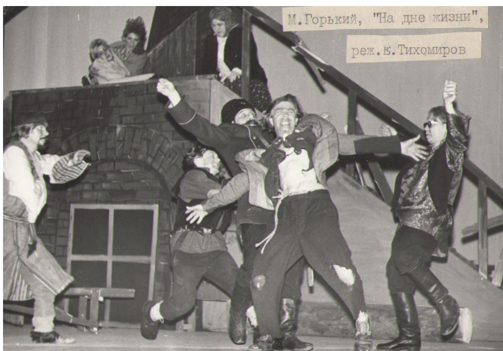
Сцена драки в ночлежке из спектакля «На дне жизни» по пьесе А.М.Горького «На дне»