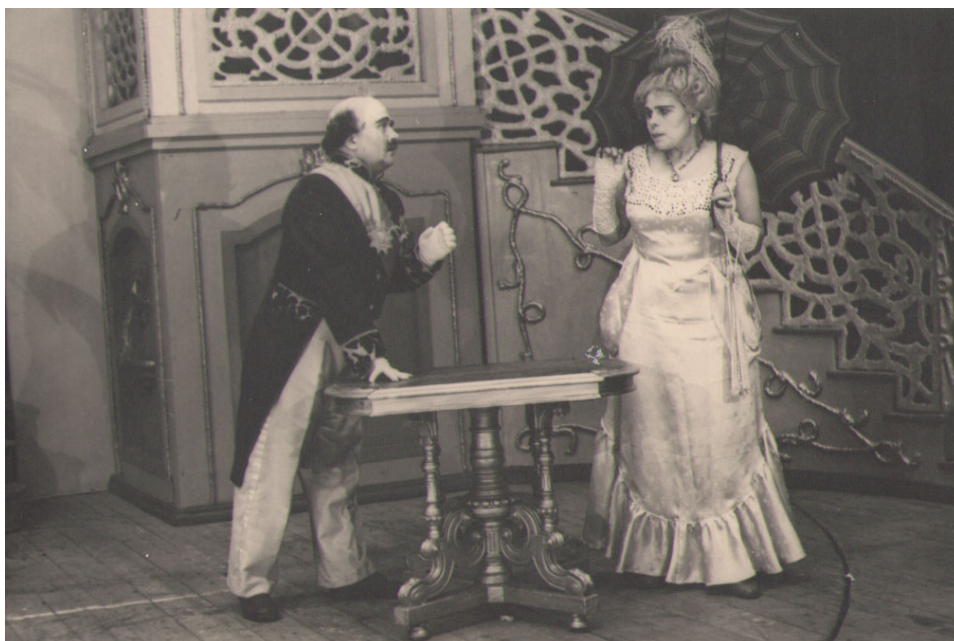
Сцена из оперетты И.Кальмана «Сильва»