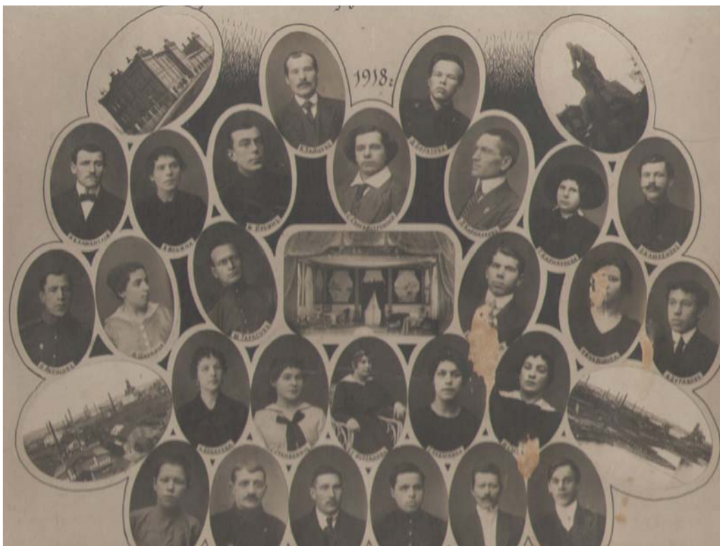
Любительский драмкружок бывших солдат. 1918