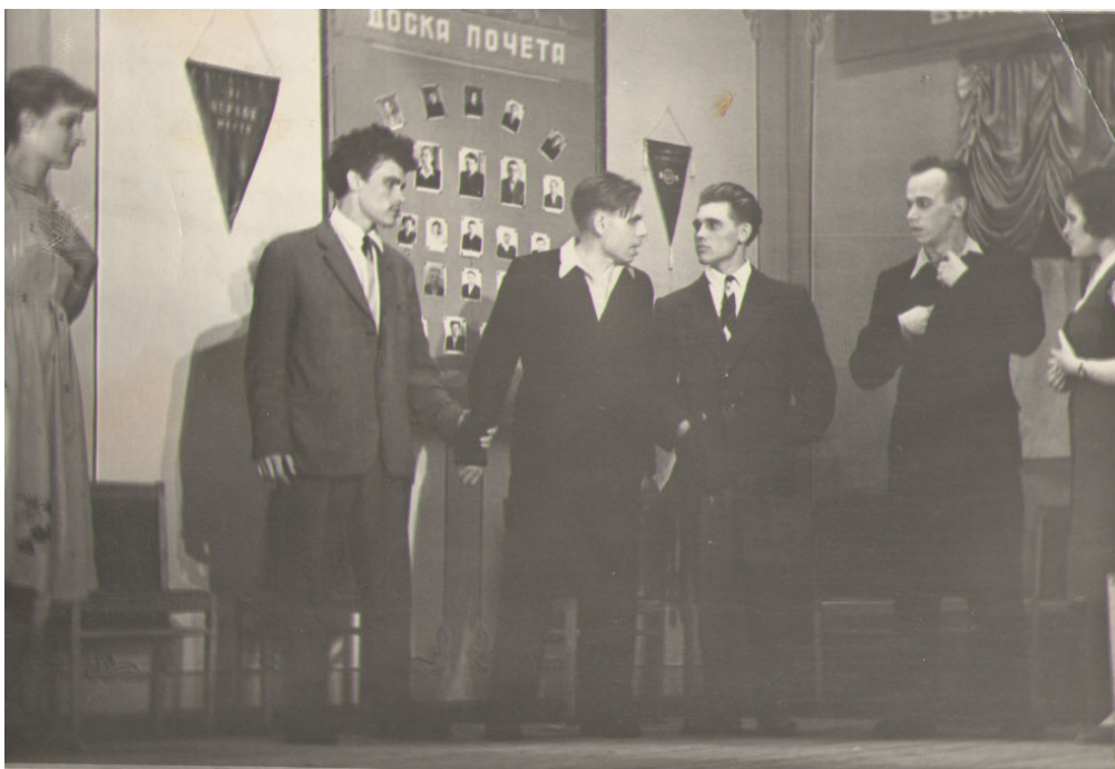
Сцена ссоры в Красном уголке из спектакля по пьесе З.Шура «Заводские ребята»