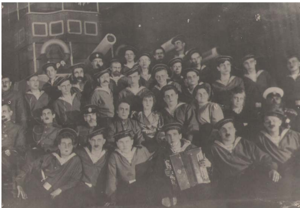
Участники спектаклю по пьесе Б.Лавренева «Разгром». 1949 г.