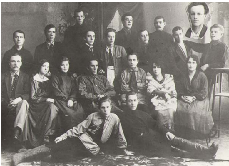
Драмкружок. 1928 г.