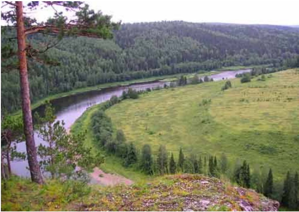
Вид с камня Ростун