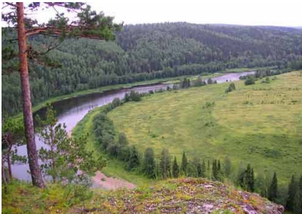
Вид с камня Ростун