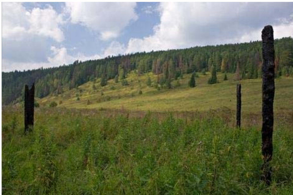
Здесь была деревня Усть-Серебряная