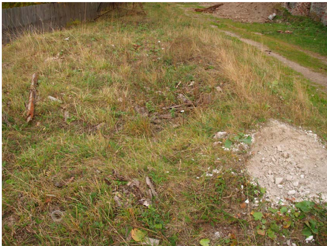
1. Снимки с места примерного захоронения бойцов Сибирской армии