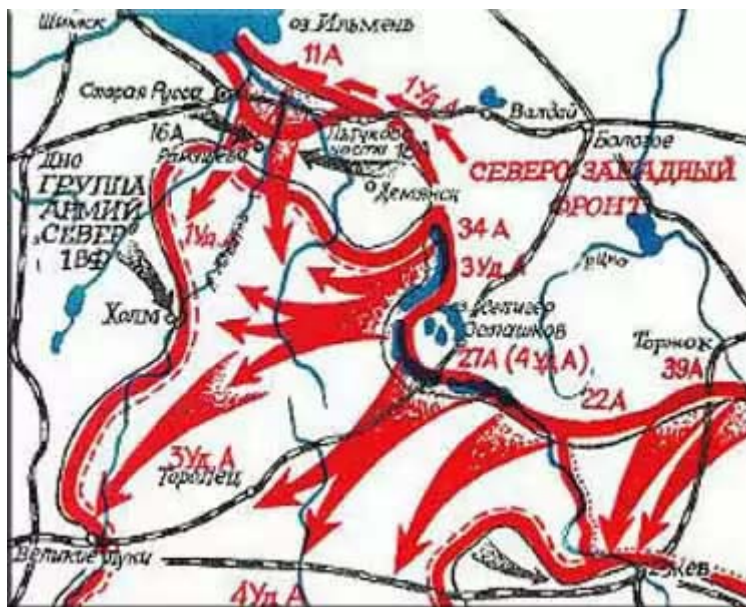
Карта боев под Старой Руссой

Город Старая Русса стал одним из символов боев Северо-Западного фронта. В целях его освобождения в 1942–1943 годах были предприняты две стратегические (Демянские) наступательные операции, сопряженные с большими потерями личного состава и не принесшие желаемых результатов.[1]